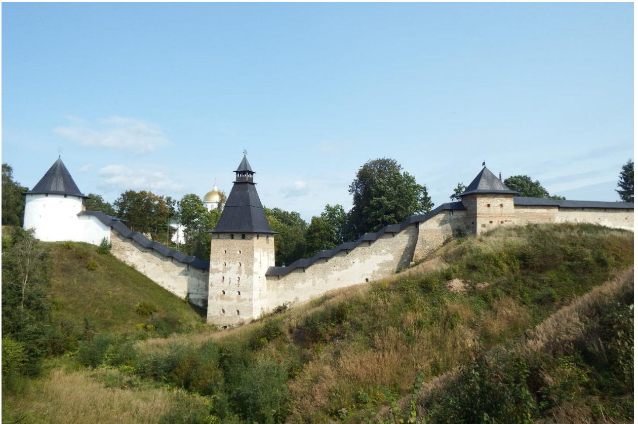
Рис. 15. Псково-Печорский монастырь, основанный в 1473 году на западной границе Псковского государства, с начала XVI в. – одно из главных пограничных укреплений Московского государства