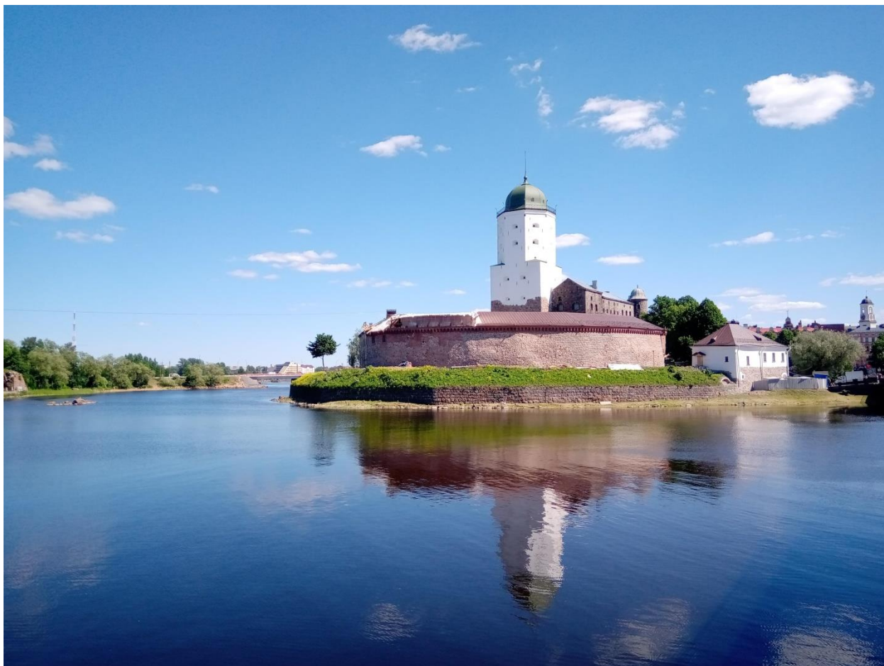
Рис. 11. Выборгский замок

В начале XIV в. к северу от Финского залива начинается продвижение шведов. В 1280 г. при устье реки Аура шведами был построен замок Або, послуживший основой для современного города Турку (шведское его название осталось прежним – Або), а в 1293 г. был основан замок Выборг.