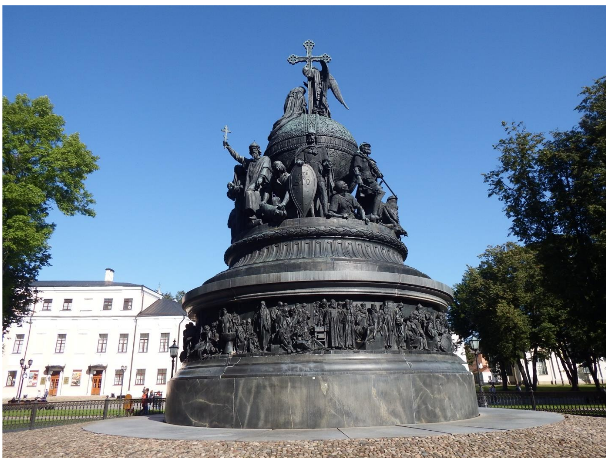
Рис. 6 . Великий Новгород, памятник Тысячелетия России, воздвигнутый в 1862 году

это государство представляло собой единый территориальный массив. Оно не имело государственной территории в том смысле, в котором мы это понимаем сейчас и представляло собой сочетание укреплений и торговых поселений в узловых пунктах речных путей. Правда, здесь следует согласиться со мнением В.Л. Янина 23 и А.А. Селина, которые призывают относиться к 862 году как к символической дате 24 . Однако В.Л. Янин, виднейший историк – исследователь Великого Новгорода, полагает, что этот год всё же близок к действительности во всяком случае в части основания самого Великого Новгорода.