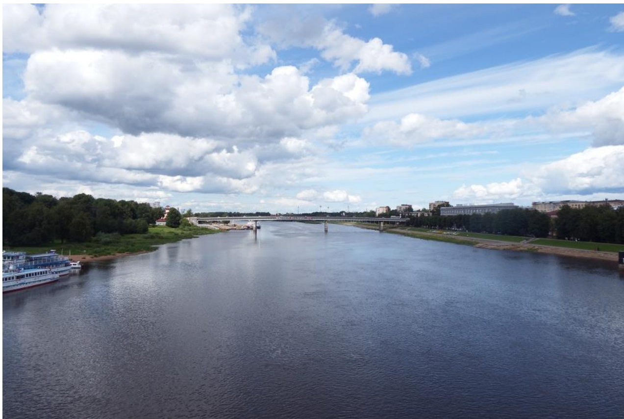
Рис. 4. Река Волхов в Великом Новгороде © фото: В.Л. Мартынов, И.Е. Сазонова, 2020.

Кроме этого, существовал путь от Балтийского моря к озеру Ильмень по реке Луга, с которой переходили на р. Мшага, приток реки Шелонь, впадающую с востока в оз. Ильмень 12 .