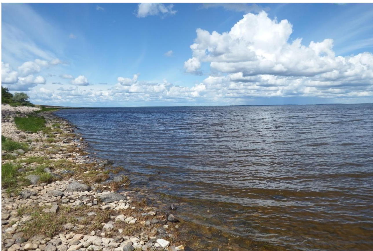
Рис. 1 . Озеро Ильмень

С запада на восток, т.е. в противоположном финским племенам направлении, в пределы нынешнего Северо-Запада продвигаются балтийские племена, предки нынешних латышей и литовцев [3]. Основным путём для проникновения балтийских племён становится р. Западная Двина, из бассейна которой эти племена переходили в бассейн р. Великая и далее на север, а также в бассейн Невы по р. Ловать и озеру Ильмень. Если предположения о направлениях движения финских племён и балтийских племён верны, то они неизбежно должны были столкнуться, двигаясь по одним и тем же речным путям во встречных направлениях.