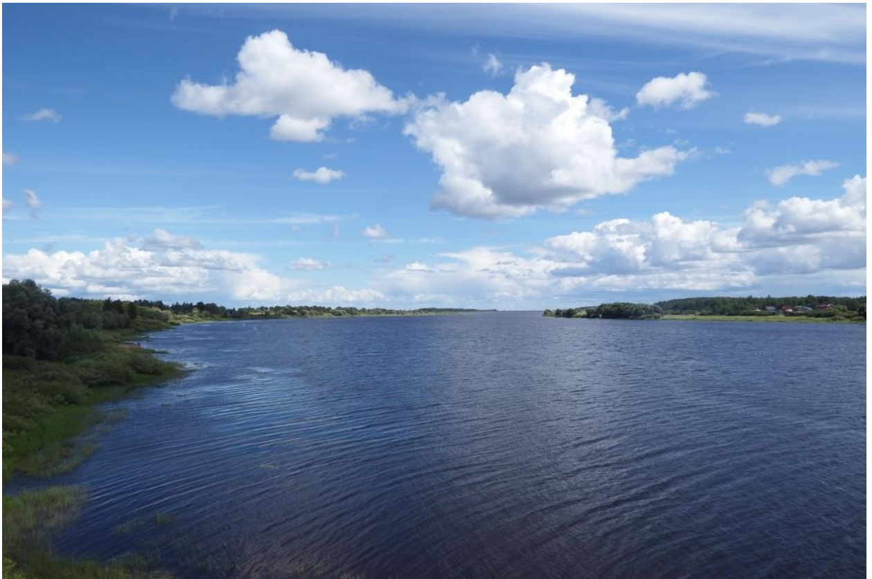
Рис. 17. Река Шелонь в нижнем течении, город Шимск Новгородской области

Но важно осознавать, что в более поздние времена параллельно всем этим путям прошли гужевые, а затем железные и автомобильные дороги. Таким образом, основы нынешней транспортной сети Северо-Запада были определены примерно восемьсот лет назад. Значение одних путей возрастало (путь по Мсте и Тверце со временем «трансформировался» в одну из коммуникационных осей России Санкт-Петербург – Москва), других сокращалось (путь вдоль Ловати от Ильменя к Великим Лукам сейчас является дорогой местного значения), формировались новые пути и направления сообщений но в целом основа «рисунка» транспортных коммуникаций Северо-Запада закладывается ещё в XII – XIII вв.