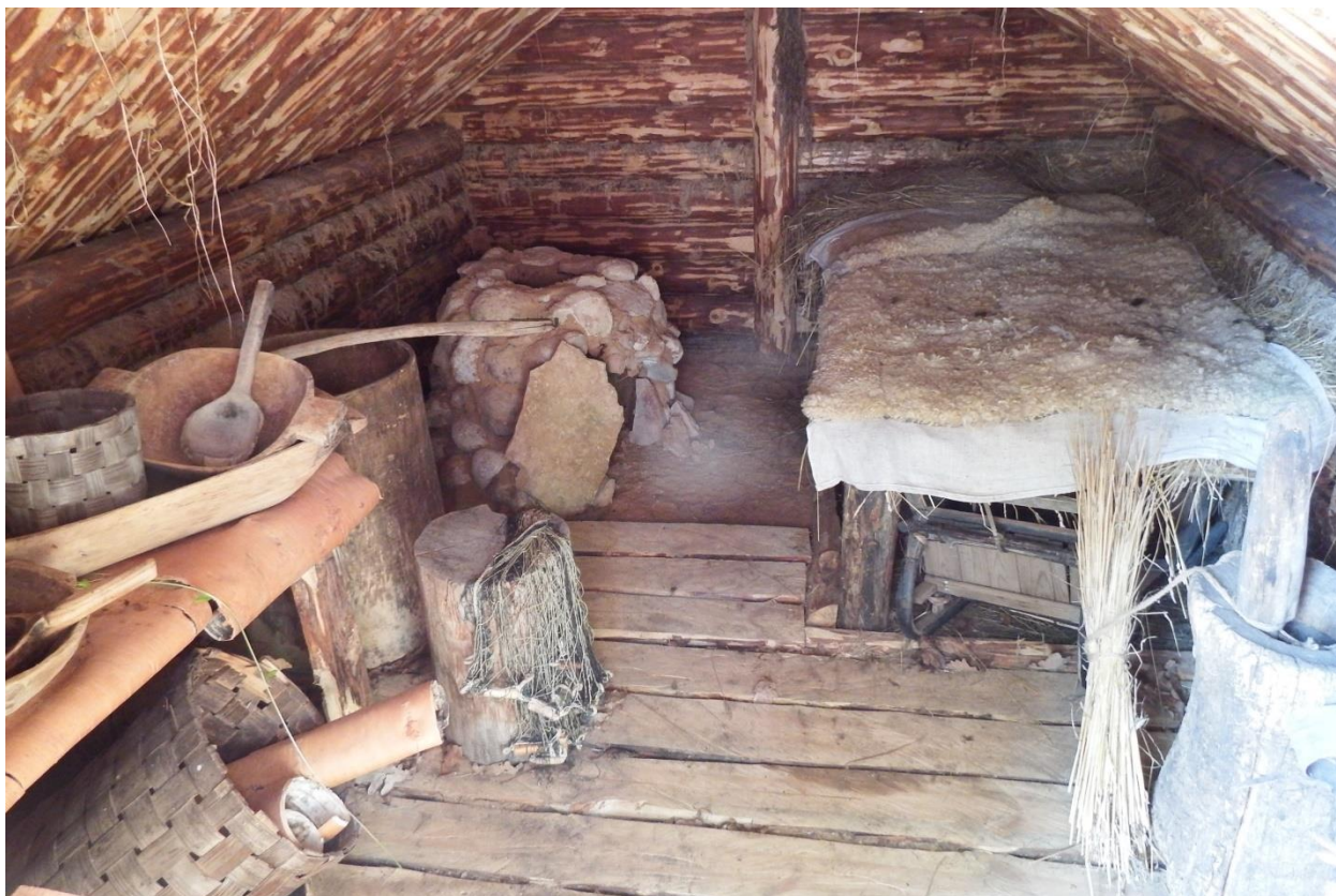
Рис. 2. Раннесредневековое жилище жителей Псковской и Новгородской земли, реконструкция. Музей Ледового побоища, д. Самолва Гдовского района Псковской области

Первые поселения представителей как славянских, так и других народов были очень небольшими. Некоторые из них обнаружены археологами (например, Городец под Лугой) 7 , но большая часть видимо, исчезла навсегда. Обнаружить следы тогдашней жилой застройки очень сложно. Обычное жилище того времени представляло собой полуземлянку размером примерно два на три метра. Естественно, что через тысячелетие от них даже следа не осталось. Такого рода жилища были распространены здесь сотни лет.