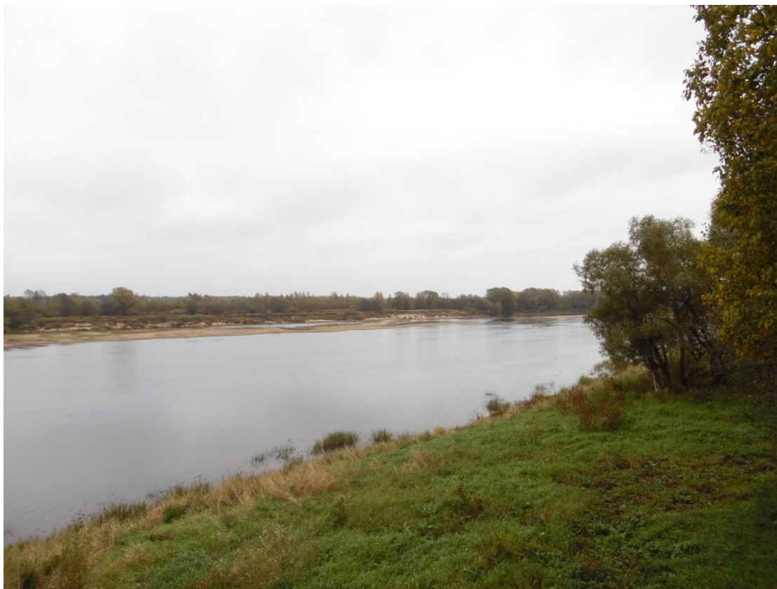
Рис. 16. Река Мста в нижнем течении у дер. Новоселицы

Существовало также ещё одно направление этого пути – от р. Ильмень по реке Пола, далее через волок в озеро Шлино и к реке Шлина, впадающей в реку Цна 38 . Этот путь использовался по крайней мере с IX в.