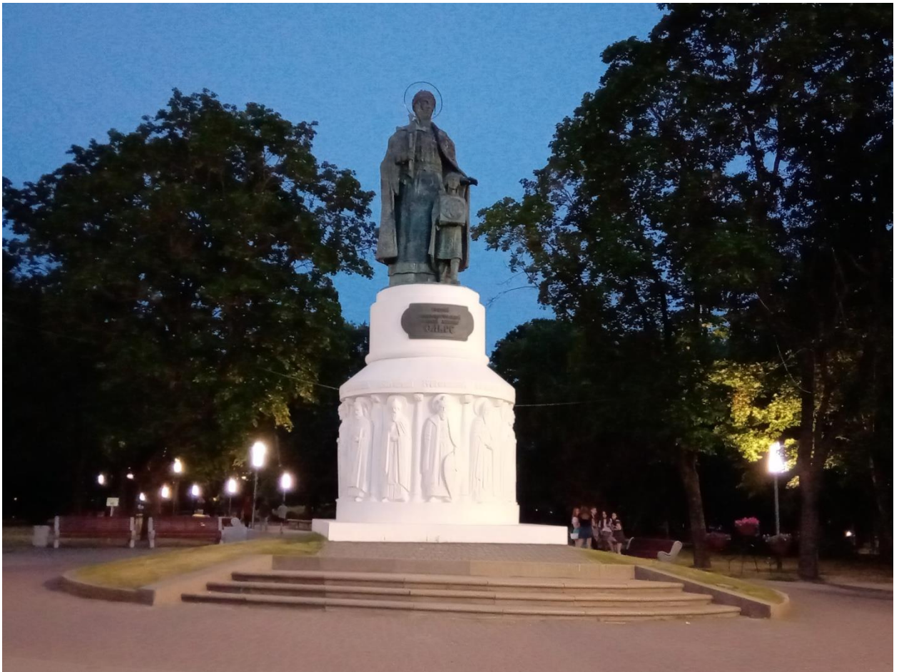
Рис. 7. Памятник княгине Ольге во Пскове

С 988 года речные пути Северо-Запада становятся путями христианизации страны. Крещение Руси произошло в Киеве, и вскоре после этого христианским становится Великий Новгород с примыкающими к нему территориями. По всей видимости, принятие христианства и его продвижения в северных землях Киевского государства было относительно мирным. Символом продвижения христианства вдоль пути «из варяг в греки» становятся три Софийских собора – в Киеве (1037 г.) на Днепре, в Полоцке (середина XI в.) на Западной Двине и в Великом Новгороде (1050 г.). Соборы св. Софии в главных городах Киевской Руси строились по образцу собора св. Софии в Константинополе, столице Византийской империи, построенного в VII в. от Рождества Христова и по сей день остающегося одним из самых крупных храмовых сооружений в истории человечества.