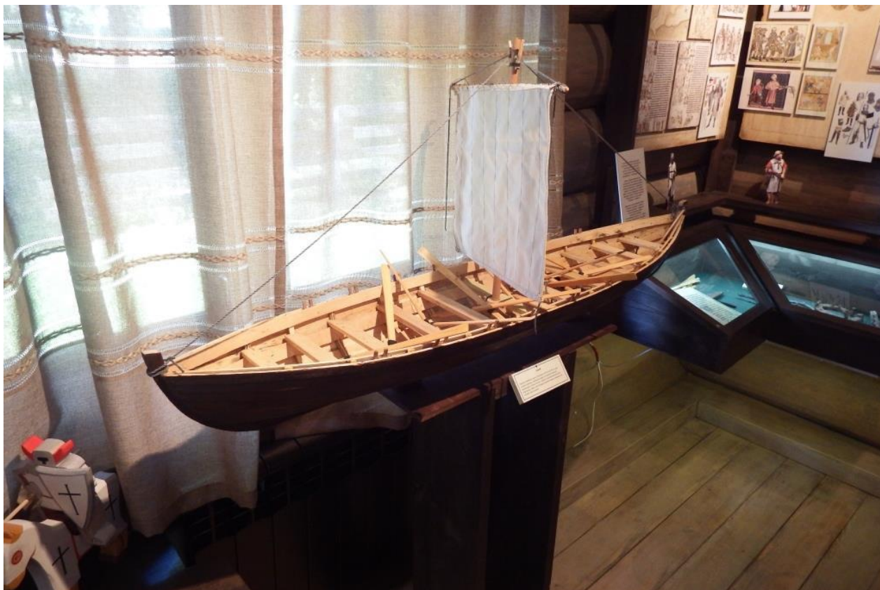
Рис. 19. Модель новгородского ушкуя, музей Ледового побоища в д. Самолва, Гдовский район Псковской области

Новгород, что способствовало росту городских богатств. Но при этом деятельность ушкуйников приводила к росту неприязни к Новгородскому государству со стороны жителей других русских государств, подвергавшихся постоянным набегам. Великий Новгород потерял всякую поддержку в других русских землях.