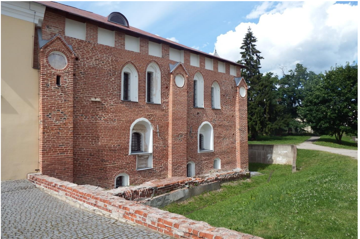
Рис. 14. Великий Новгород, Грановитая палата, XV в. Резиденция высших органов власти Новгородского государства в конце его существования

Политический строй Новгородского государства был очень сложным. Видимо, в начальный период существования государства главным его правящим органом было вече, ближе к концу – «совет господ». Кроме этого, вече собиралось в каждом из «концов» города.