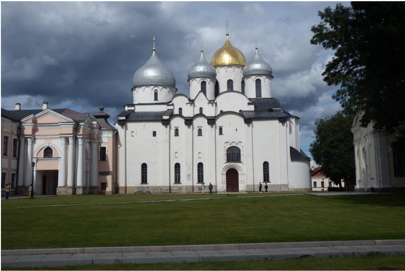
Рис. 9. Великий Новгород, собор Святой Софии, главный собор Новгородского государства XII – XV вв. До середины XVII в., как и все остальные кирпичные соборы и церкви на Руси, был кирпичного цвета

Границы Новгородского государства с другими государствами, образовавшимися на руинах исчезнувшей Киевской Руси, были весьма причудливы. На западе эти основу этих границ представлял собой водораздел бассейнов рек Великая и Ловать с одной стороны и бассейн Западной Двины с другой. Бассейны Великой и Ловати практически полностью оказались во владении Новгородского государства, бассейн Западной Двины стал владением Полоцка. Новгородское и Полоцкое государство на протяжении длительного времени враждовали друг с другом, пока полоцкие владения не оказались поделёнными между Ливонским орденом и Великим княжеством Литовским. Нынешняя граница России, Латвии и Белоруссии, «наследников» Новгородского государства, Полоцкого княжества и Ливонского ордена в этих краях в значительной мере, хотя и