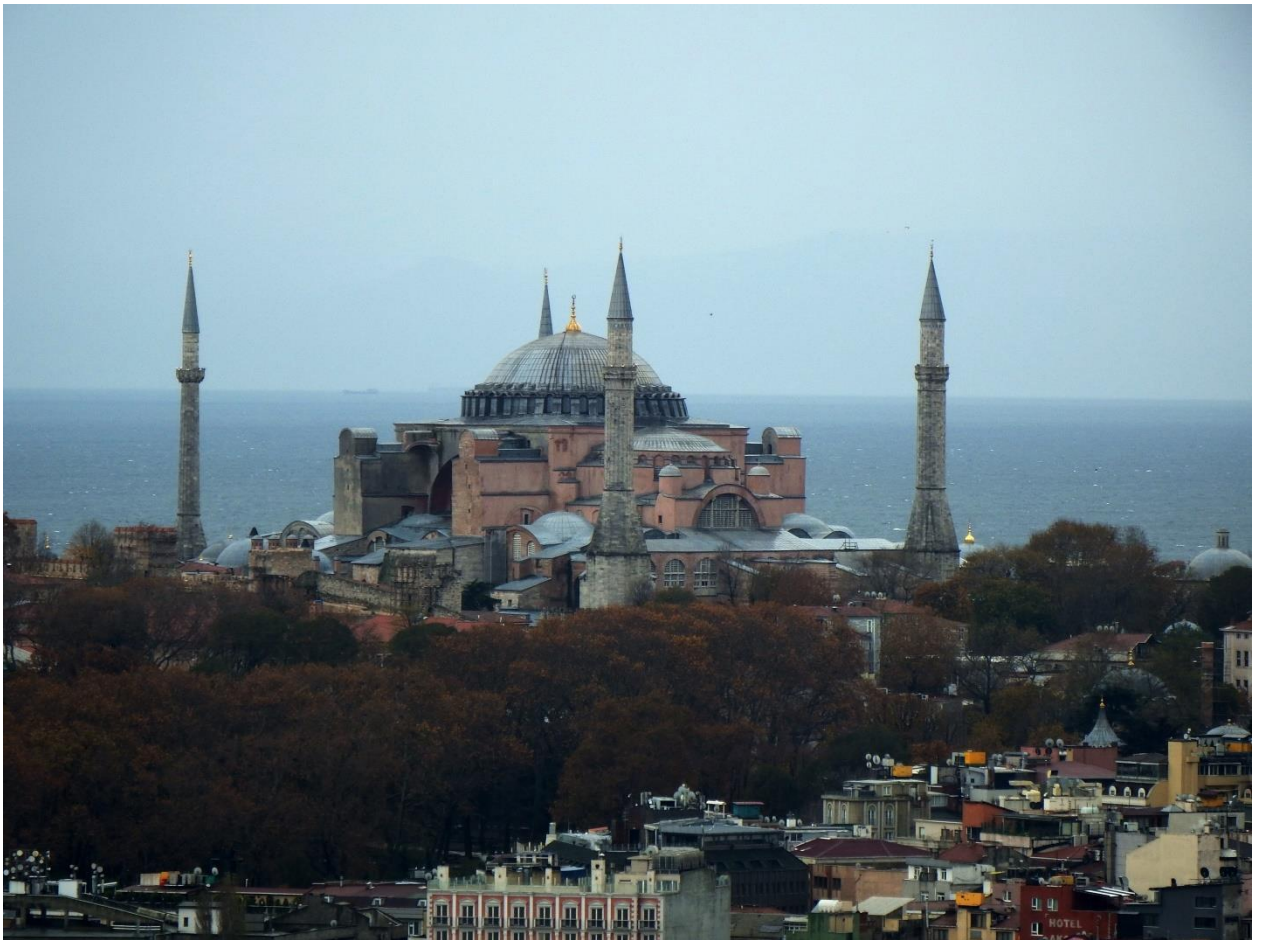
Рис. 8. Собор св. Софии Константинопольской (минареты по углам собора построены после завоевания Константинополя турками в 1453 году)

Но Софийские соборы в русских землях были, конечно же, намного меньше. Во всех трёх бывших главных городах Киевской Руси, Великом Новгороде, Киеве и Полоцке соборы св. Софии сохранились по сей день, но их внешний облик, бывший почти одинаковым тысячу лет назад, ныне отличается очень сильно. Строились также церкви в других поселениях; церковь становится обязательным элементом застройки погостов, являвшихся местами торгового оборота и сбора дани.