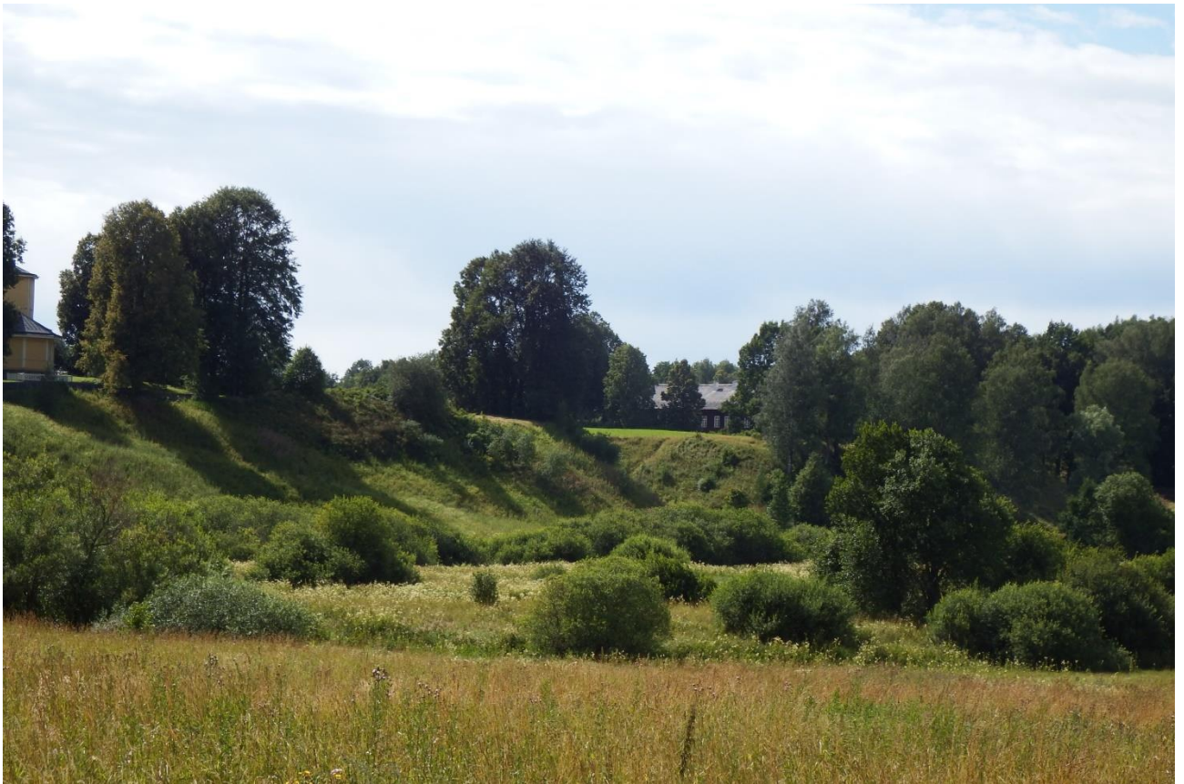
Рис. 13 . Городище Воронич, Пушкиногорский район Псковской области

Следует отметить, что на протяжении всей истории новгородской независимости Великий Новгород не основал ни одного нового торгового города, а крепости строил только в случае крайне необходимости. Это можно связать с тем, что Новгородское государство боялось возможной конкуренции со стороны новых городов Великому Новгороду, которая могла завершиться распадом новгородских владений. Но в конце новгородской истории отсутствие других, кроме Великого Новгорода, политических и экономических центров способствовало краху новгородского государства.