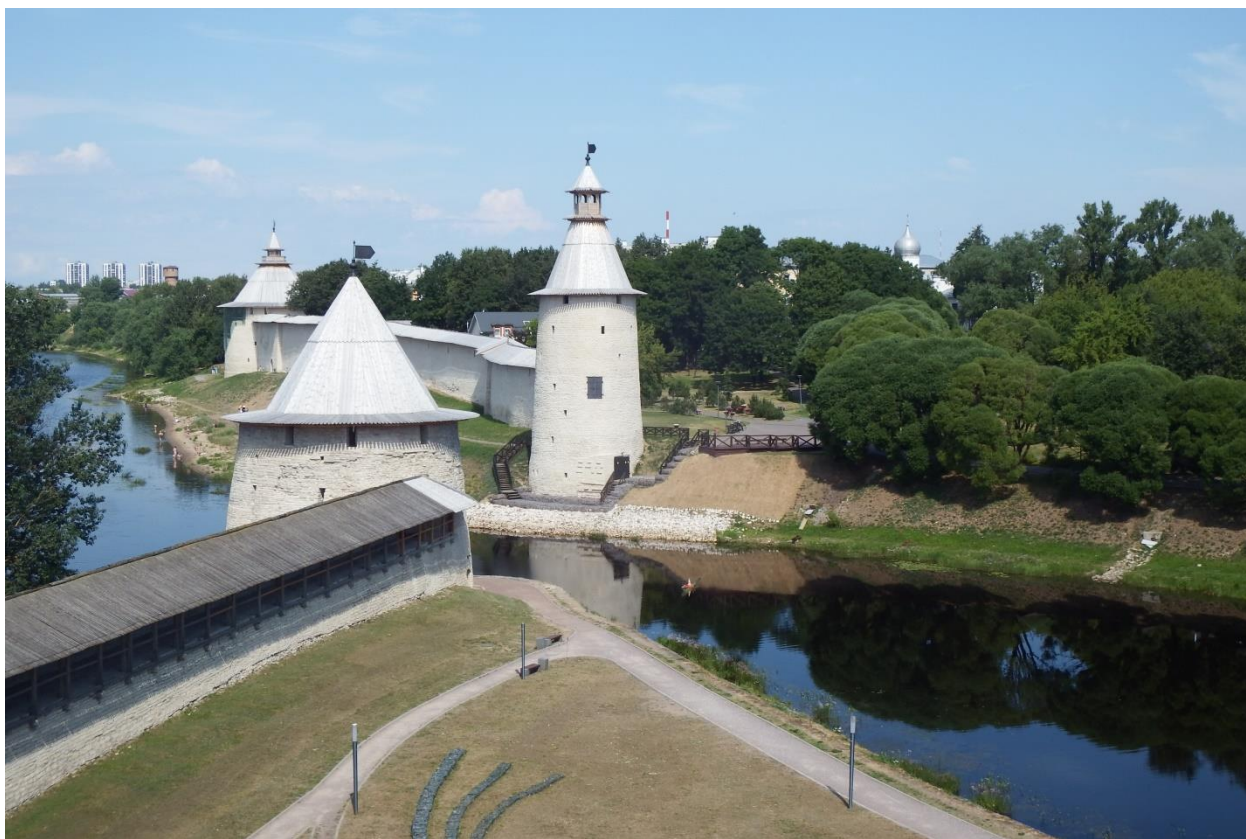
Рис. 29. Псков, Нижние решётки (средневековые оборонительные сооружения в месте впадения реки Псковы в реку Великая

Особенно быстро значение Пскова и транспортных путей, через него проходящих, стало расти с начала XVI в., с началом эпохи Великих географических открытий и морских войн. И для того, и для другого западно-европейским государствам был нужен флот. Флоту нужны были паруса, которые изготавливались из льна, и канаты, которые делались из пеньки. Псковская земля поставляла в Европу и то, и другое.