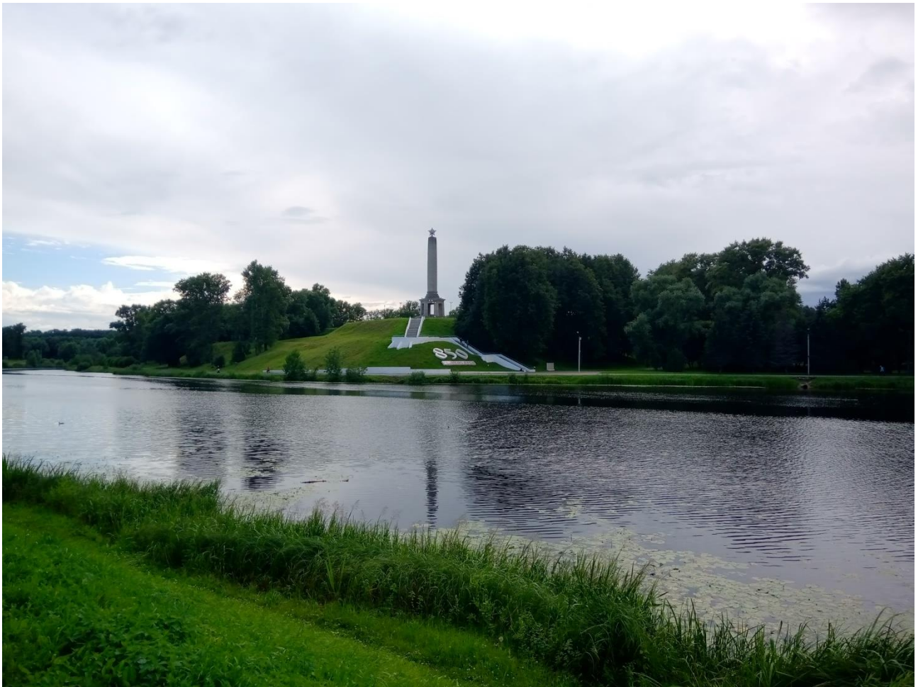
Рис. 26. Река Ловать в Великих Луках

Деревская пятина располагалась между Ловатью и Мстой, выходя к границам Новгородского государства с землями Тверского и Московского княжеств. Границы Обонежской пятины от Великого Новгорода расходились по Волхову и Мсте, а продолжение этих границ с двух (обеих) сторон огибало Онежское озеро (отсюда название) и доходило до Белого моря. Огромность территории этой пятины «компенсировалась» развитостью системы путей сообщения в её пределах. Самые дальние заонежские погосты этой пятины были легко достижимы из Великого Новгорода благодаря пути по Волхову, Ладожскому озеру и Свири.