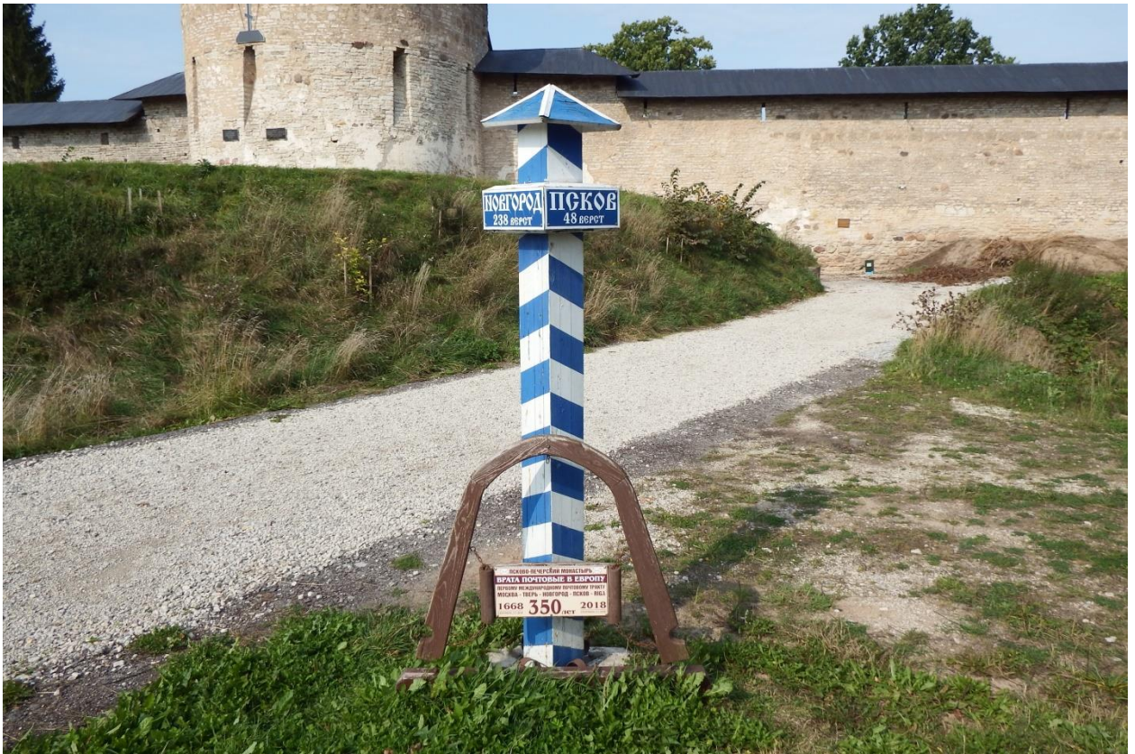
Рис. 35. Памятный «почтовый столб» у Псково-Печорского монастыря; монастырь был крайней западной почтовой станцией Московского государства

Продолжали существовать дороги от Новгорода на Ивангород, ставший частью Нарвы, которая пересекалась границей Московского царства и Шведского королевства несколько южнее современного пос. Дружная Горка Гатчинского района Ленинградской области у дер. Старое Болото, и дорога от Новгорода на Гдов. Через Гдов также проходила дорога от Пскова на Ивангород и Нарву [ 19 ]; наибольшее сходство трассы старинной дороги и современного шоссе Псков – Гдов – Сланцы отмечается на южном участке, от Пскова до Гдова.