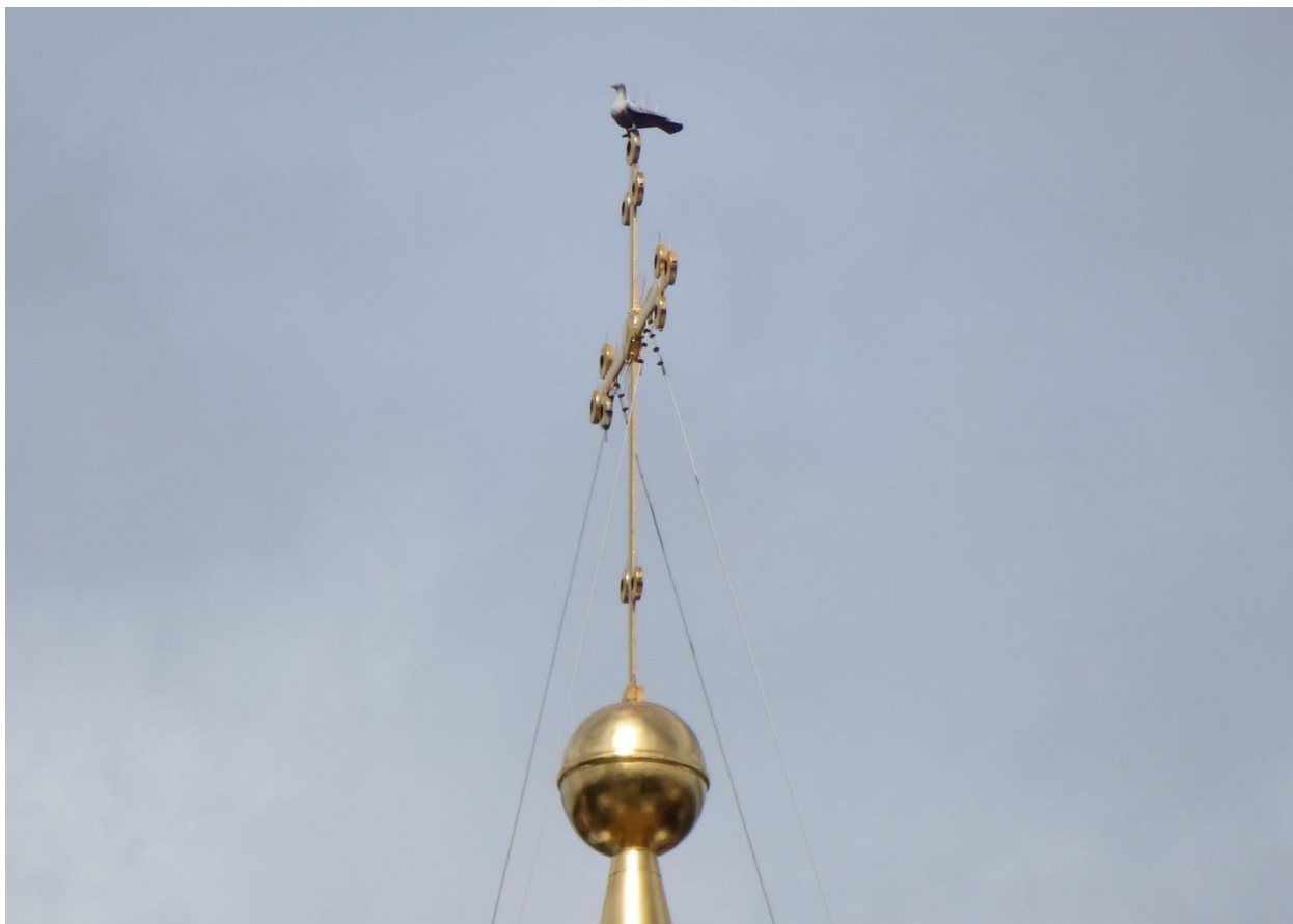
Рис. 25 . Фигура голубя на кресте собора св. Софии в Великом Новгороде

мимо голубь. Посмотрев вниз и увидев происходящее, он застыл от ужаса. С тех пор на этом кресте всегда помещается фигура голубя, в православии и вообще христианстве олицетворяющая третью ипостась Святой Троицы – Бога – Духа Святого.