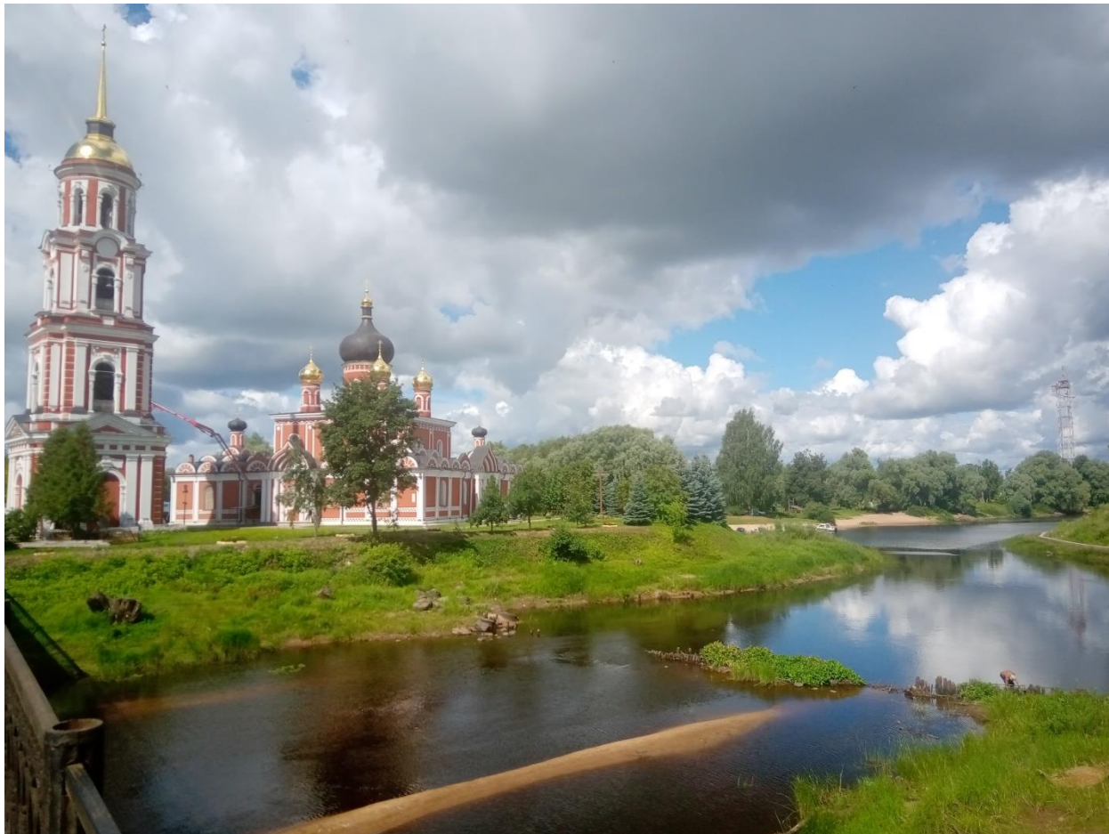
Рис. 32. Старая Русса, река Полисть

также добывалась из минеральных источников. Экономическое значение Старой Руссы было чрезвычайно велико – в XVI в. город занимал четвертое место в России по численности населения после Москвы, Пскова и Великого Новгорода.