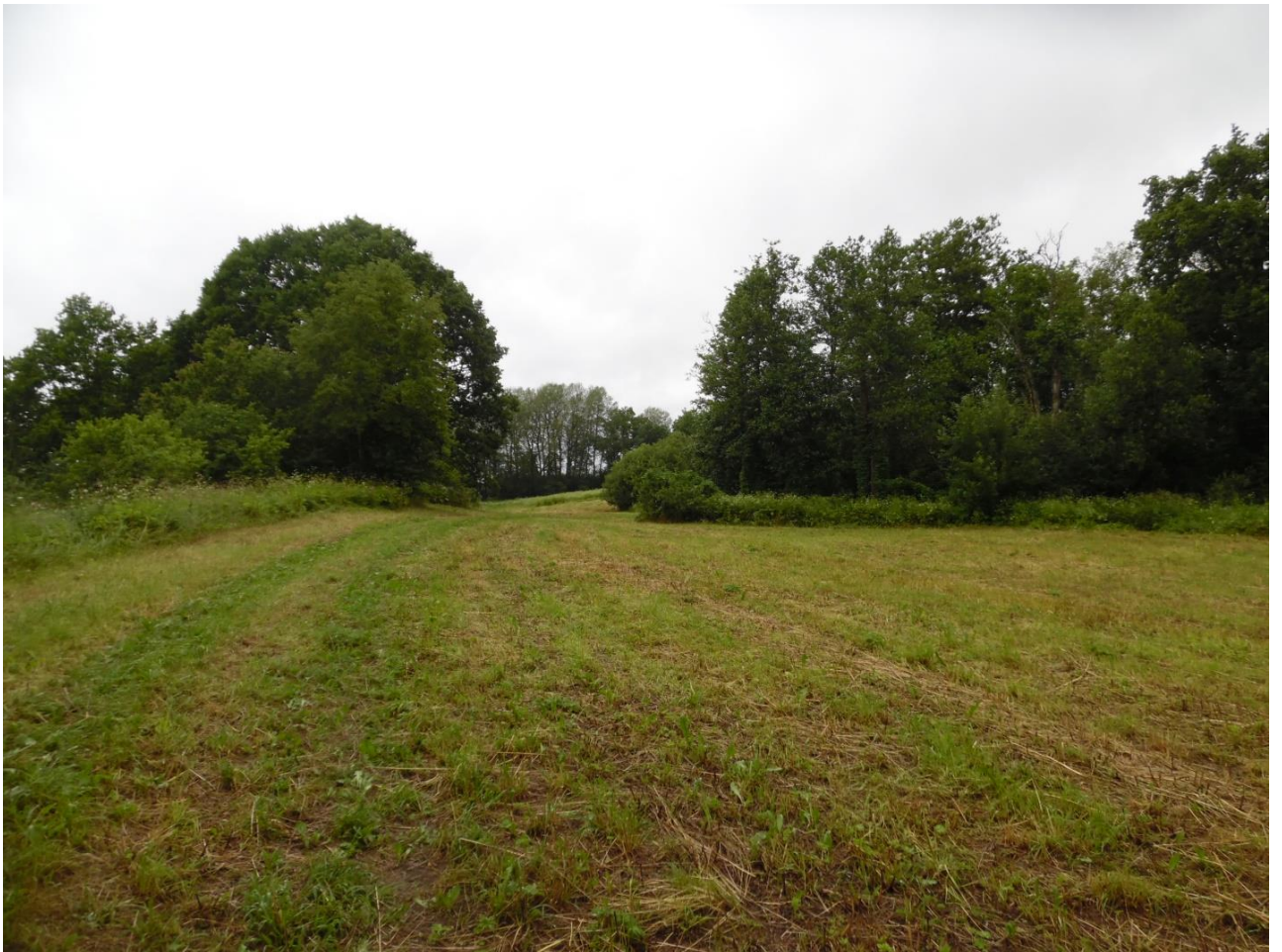
Рис. 21. Место, где находилась крепость Заволочье – одна из самых крупных московских крепостей XVI – XVII веков (дер. Копылок, Пустошкинский район Псковской области)

Следующая попытка сдвинуть московские границы в Прибалтике в западном направлении предпринимается примерно через шестьдесят лет, в царствование Ивана Грозного. В этот раз воевать решили не со Швецией, а с более слабым противником, владения которого располагались на южном берегу Балтийского моря – Ливонским орденом. Немецкие католические рыцарские ордена обосновались на этих территориях в XIII века, и пик их могущества был уже далеко позади. Один из этих орденов, Тевтонский, в 1525 году был преобразован в светское протестантское герцогство Пруссия со столицей в Кёнигсберге, вассала Польского королевства. Второй орден, Ливонский, продолжал своё существование, но силы его буквально таяли. Это было связано с церковной Реформацией в Европе, начавшейся в 1517