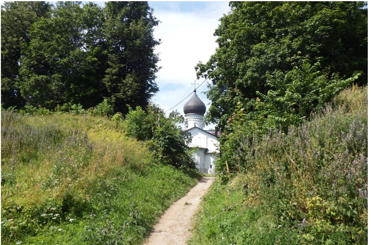
Рис. 30. Гдов, остатки крепостных стен

В 1558 г. начинается Ливонская война, в ходе которой московские войска на долгое время занимают Нарву и Дерпт. Это приводит к резкому усилению псковской торговли, по скольку оба главных пути, соединявших Псковскую землю с Балтийским море, оказались в руках Московского государства.