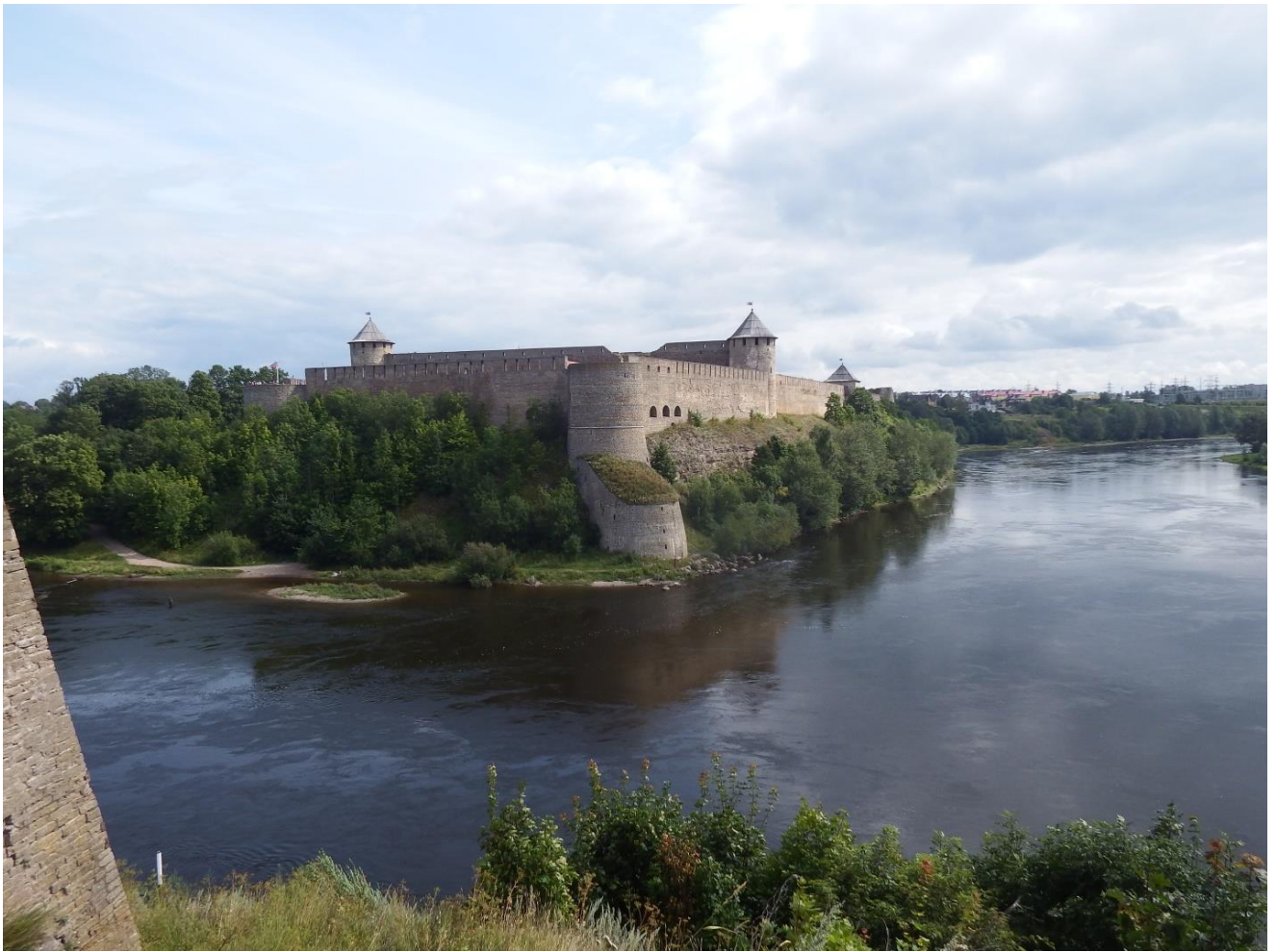
Рис. 20. Крепость Ивангород, вид с западного берега реки Нарова

Московско-шведская война 1495 – 1496 годов закончилась безрезультатно, граница между Московским государством и Шведским королевством не изменилась.