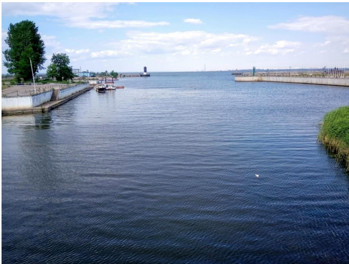
Рис. 24 . Нижнее течение реки Стрелка в пос. Стрельна (С.-Петербург), где в 1583 – 1595 годах проходила граница Московского государства и Швеции

районе нынешнего г. Сестрорецк) остался в составе Московского государства 1 .