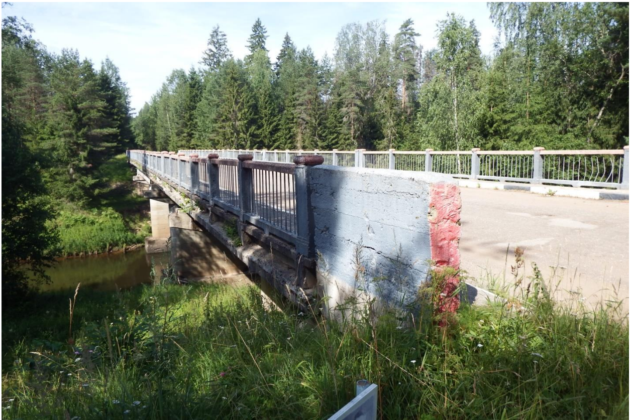
Рис. 23. Мост через реку Плюсса в районе дер. Сербино. Здесь проходила старинная дорога от Новгорода на Гдов, ныне – дорога Заполье – Гдов

Новая граница на западе начиналась от устья р. Плюсса (тогда название реки писалось с одним «с» - Плюса), впадающей в р. Нарова (Нарва), от которого переходила на р. Луга выше крепости Ям, шла по Луге и от неё сворачивала в меридиональном направлении к берегу Финского залива, выходя к нему по р. Стрелка. На Карельском перешейке в 1583 году впервые в качестве государственной определяется граница, проходившая через весь перешеек с запада на восток по рр. Сестра и Вьюн, и впоследствии после ряда преобразований ставшая границей России и Финляндии (в 1811 – 1917 годах – внутригосударственной, с 1917 по 1940 год – межгосударственной).