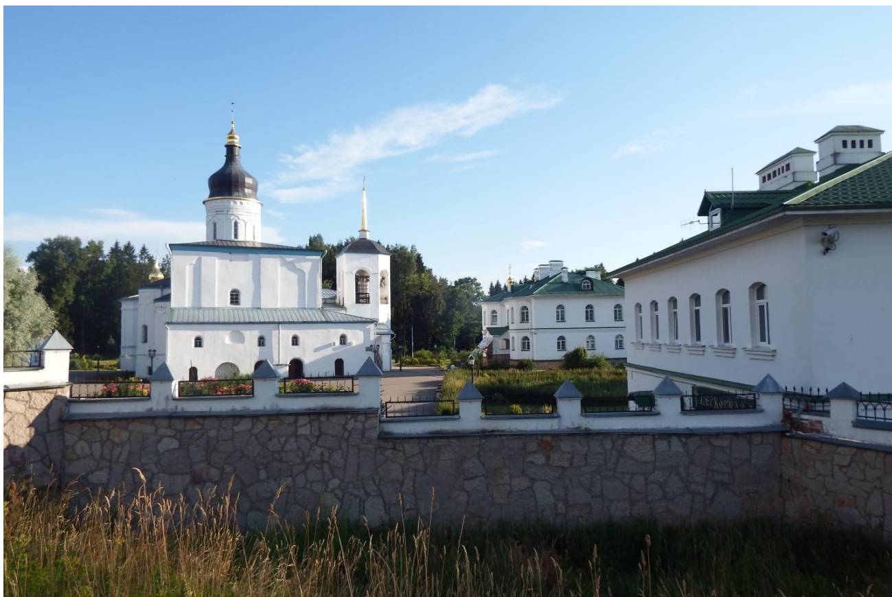
Рис. 28. Спасо-Елеазаров монастырь

Впервые это утверждение встречается в посланиях Спасо-Елеазаровского монастыря Филофеем в его посланиях великому князю Московскому Василию III и другим должностным лицам Московского государства ориентировочно в 20-е – 40-е годы XVI в. Следует отметить, что основное содержание этих посланий слабо связано с идеей «Москвы – Третьего Рима», и посвящена самым разным вопросам церковной и социальной жизни (борьбе с католичеством, делам русского православия, борьбе с «содомским грехом», т.е. гомосексуализмом). Никакой развёрнутой религиозно-философской концепции «Москвы – третьего Рима», как это иногда утверждается, в этих посланиях не содержится. Основное развитие этой идеи приходится на конец XVIII – начало XX веков, когда основным направлением расширения пределов Российского государства становится южное.