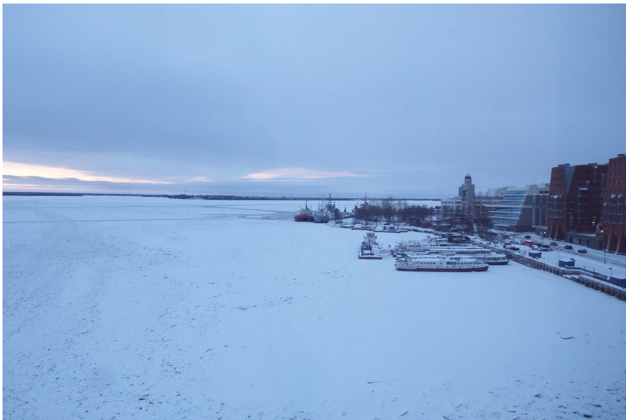
Рис. 31. Архангельск, Северная Двина в нижнем течении зимой

Михайло-Архангельскому монастырю, существовавшему в устье Северной Двины с конца XIV в.) [7].